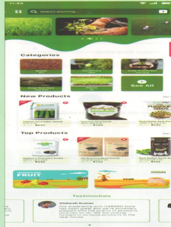
चित्र : मोबाइल ऐप में विभिन्न उत्पादों का दृश्य