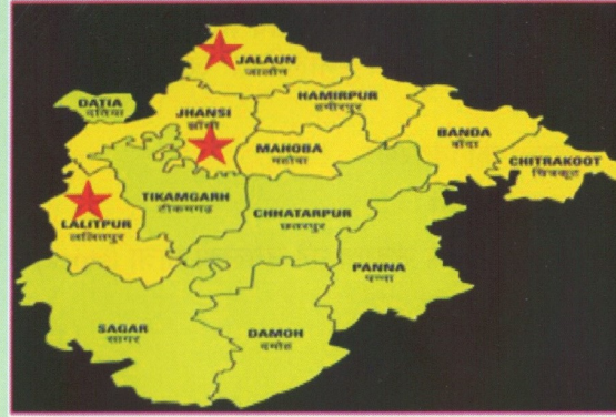
चित्र : परियोजना कार्यक्षेत्र (बुंदेलखंड)

प्रायोगिक रूप से इस परियोजना की शुरुआत उत्तर प्रदेश के तीन जिले (झाँसी, ललितपुर एवं जालौन) से किया जा रहा है। इन तीन जिलों के किसान उत्पादक संघों, स्वयं सहायता समूहों तथा उन किसानों को जोड़ा जायेगा जो अपने उत्पादों को उपभोक्ता तक पहुँचाना चाहते हैं।